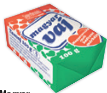
Magyar Teavaj 100g, 4990Ft/kg