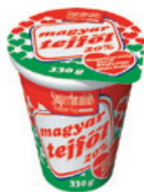
Magyar Tejföl 20% 330g 1512 Ft/kg