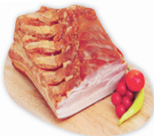
Palani Füstölt-Főtt Császárszalonna 3590 Ft/kg