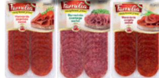
Familia Harmónia Szeletelt Csemege / Paprikás / Csípős Szvg 55g 7800 Ft/kg