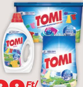
Tomi Color Gél 19Mosás 0.855l, 1753 Ft/l / Amazonia Freshness Por 17Mosás 1.02 kg 1470Ft/kg/ 3+1 Power Color Caps 13db 115 Ft/db