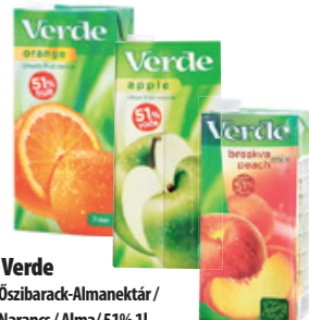
Verde Őszibarack-Almanektár / Narancs / Alma / 51% 1l