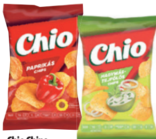
Chio Chips Hagymás-Tejfölös / Paprikás 60g, 7817 Ft/kg