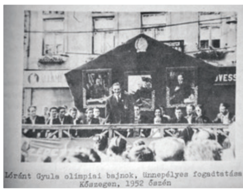
Lóránt Gyula olimpiai bajnok, ünnepélyes fogadtatás Kőszegen, 1952 őszén

A nemzet mostanra már emlékezik a legnagyobb hősökre. Talán örökre fennmarad ez a klasszikus névsor, az Aranycsapat tagjainak a neve. Sokaknak nem adatott meg az olyan élet, amit nagyon megérdemelt volna. Az emlékek őrzése egy kötelesség. Ebben jó példát mutat Kőszeg.