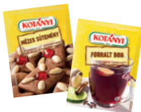
Kotányi Fűszerkeverék Mézessütemény 27g / Forraltból Instant Fűszeres Izesítő 35g