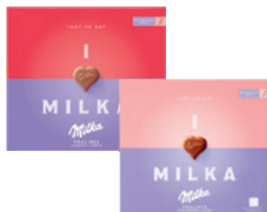
Milka I Love Milka Desszert Eperkrémes / Mogyorókrémes 110g, 8173 Ft/kg