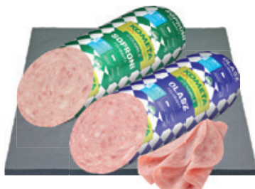
Kométa Útravaló Felvágott Soproni/Olasz 2990 Ft/kg