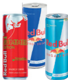
Red Bull Energy Drink Classic / Cukormentes / Görögdiinnye 0.25l, 2396 Ft/l