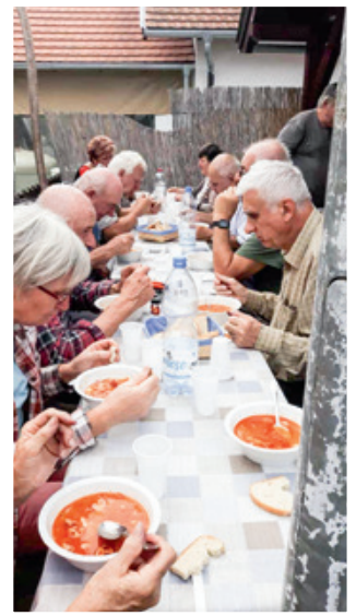
Dobro račenje nij' falilo kod „tobračev”

Hagyománszerűen gyűlekeztek október első hétvégéjén a Stefanich birtokon a horvát közösség tagjai, hogy a Maligán túra elő-ményeként segítsék a szőlő szüretelését. Kék-frankos és Blauburger fajták szedésére került sor, amit a házigazdák babgulyással és fosz-lós kaláccsal köszöntek meg, természetesen a helyi finom nedűk kíséretében.