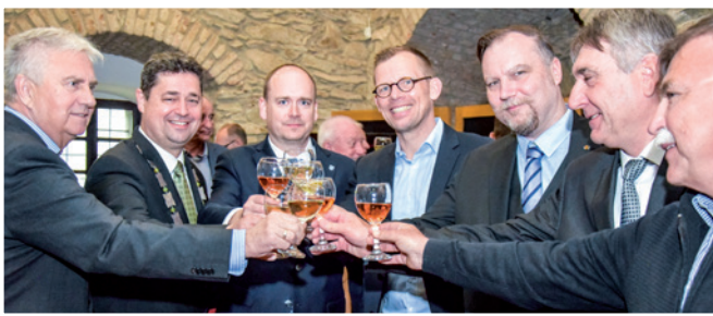
Kőszeg Város vendégei Szent György-napján

gyünk itt Kőszegen, már előre örülök a következő találkozásoknak. A városban folytatódjon tovább a ma látott ünnepségsorozat, amelyet egyedinek tartok. Lenyűgöző volt a borkirálynő szereplése, csodálatosan táncoltak a kislányok, a katonákat marconának, határozottan láttam, és annak örültem, hogy barátok vagyunk, és azt kívánom: mindez folytatódjon.