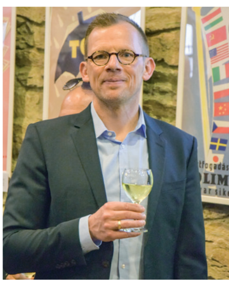
Uwe Skrzypek főpolgármester

– Erős volt annak a hatása, hogy több város közössége találkozott Kőszegen, amit jónak tartok, mert a testvérvárosi kapcsolatoknak a nemzetek, népek közötti jobb megértés erősítése a legfontosabb célja.