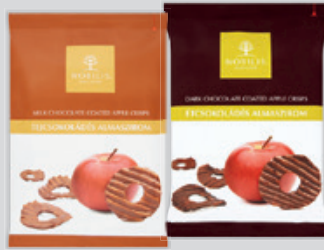
Nobilis Almaszirom Tejsokoládés / Étsokoládés 50g, 9 980 Ft/kg