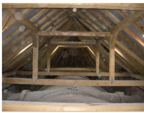
A Szent Vér-temetőkápolna tetőzete