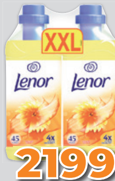
Lenor Öblítő Summer Breeze Duo 2X1360ml, 808 Ft/l