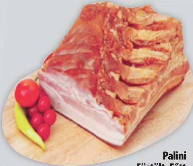
Palini Füstölt - Főtt Császárszalonna 3990 Ft/kg