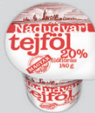
Nádudvari Tejföl 20% 140g, 2850Ft/kg