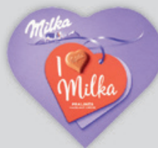
Milka I Love Mogyorókrémes Dessz. 44g, 10 432 Ft/kg