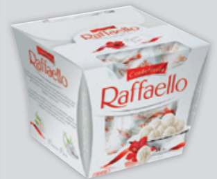
Raffaello T15 150g, 7 993 Ft/kg