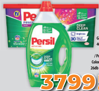
Persil Expert Gél Normál 40mosás 2l 1900Ft/l /Power Caps Color 26mosás 26db 146 Ft/db