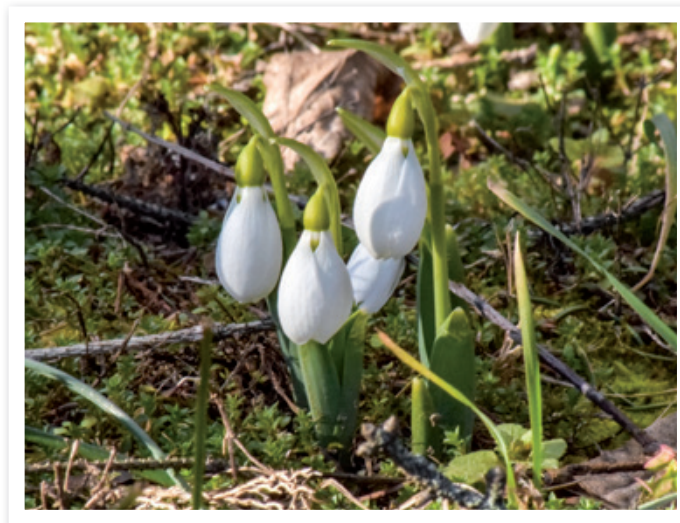
Nyílik a hóvirág a Temető utcában