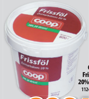
Coop Frissfő! 20% 800g, 1124Ft/kg