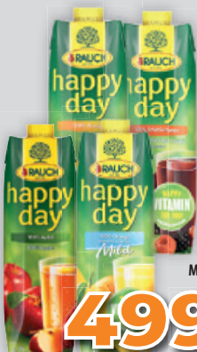
Rauch Happy Day 100% Narancs/ Alma/Piros Multivitamin /Narancs Mild+Calcium 1l