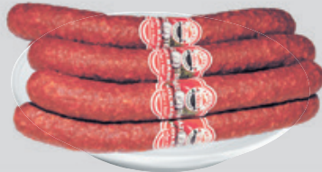
PrivátHús Házi Füst. Kolbász Vg. 3 490 Ft/kg