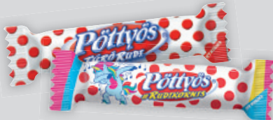
Pöttyös Túrudi Natúr/Unikomris 30g, 6 633 Ft/kg