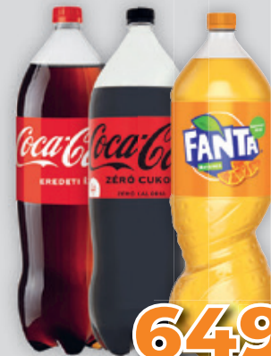
Szénsavas Üdítőital Coca-Cola/ Coca-Cola Zero/ Fanta Narancs Pet 2.25l, 288 Ft/l