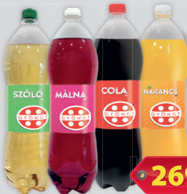
Márka Gyöngy Cola / Málna / Narancs / Szőlő 2l, 135Ft/l