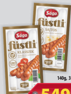
Sága Füstli Klasszik/ Sajtos 140g, 3921 Ft/kg