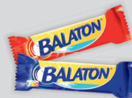
Balaton Töltött Ostyá Tej/Ét 30g, 5967 Ft/kg