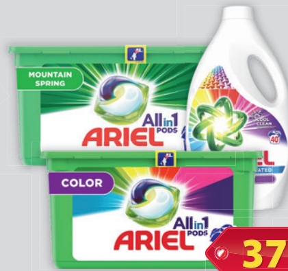
Ariel Mosógél Color 40Mosás 2.2l, 1727Ft/l / Mosó kapszula Color&Style / Mountain Spring 26db 146 Ft/db