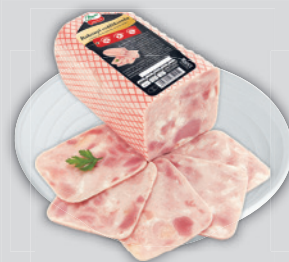
Pápai Bakonyi Csülöksonka 3990 Ft/kg