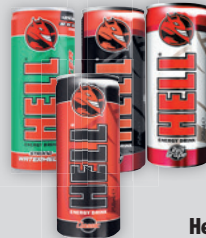
Hell Energiaital Classic / Red Grape Strong / Strong Apple / Strong Watermelon 0.25l, 956 Ft/l