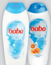
Baba Tusfürdő Lanolinos / Kamilla és Méz 400ml, 2.248 Ft/l