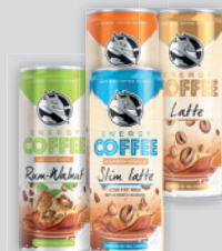
Hell Energy Coffee Latte / Sós-Karamellás / Rum Walnut / Slim Latte 250ml, 1316 Ft/l