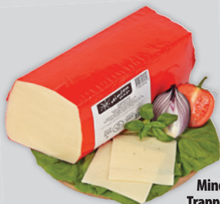
Minden Nap Trappista Sajt