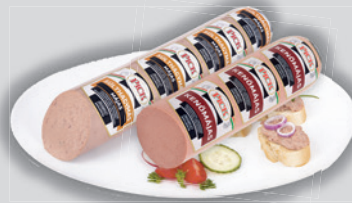
Pick Kenőmájás Eredeti / Sülthagymás 2390 Ft/kg