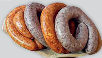
Privát Sütni Való Hurka Májjas/Véres / Húsos Vg. 2190Ft/kg