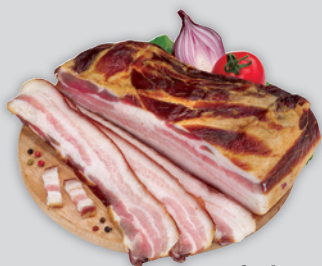
Esztfoot Kolozsvári Szalonna 3190Ft/kg