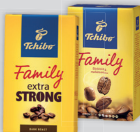
Tchibo Family Kávé Őrölt Classic / Extra Strong 250g, 3396 Ft/kg