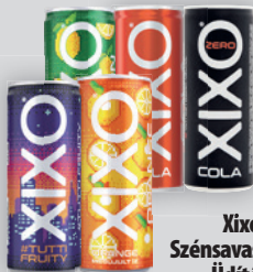
Xixo Szémsavas Üdítő Cola / Zero Cola / Lemon / Orange / Tutti Frutti 250ml, 796Ft/l