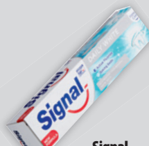
Signal Daily White Fogkrém 75ml, 4.920 Ft/l