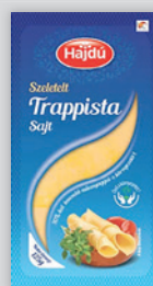
Hajdú Trappista Sajt Szeletelt 125g, 5432 Ft/kg