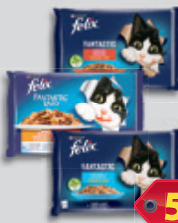
Felix Fantastic Nedves Macskaeledel Lazac-Lepényhalas vagy Marha-Csirkes vagy Duo Házias Válogatás Aszpicban 4X85g, 1 762 Ft/kg