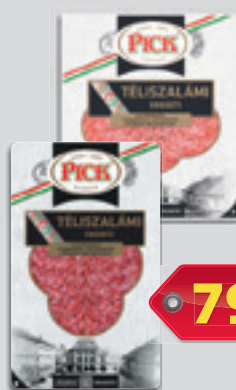
Pick Téliszalámi Eredeti vagy Körtálcás Szeletelt Vg. 70g, 11414 Ft/kg