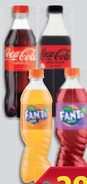
Szénsavas Üdítőital Coca-Cola vagy Coca-Cola Zero vagy Fanta Narancs vagy Fanta Kékszló Pet 0.5l, 598 Ft/l