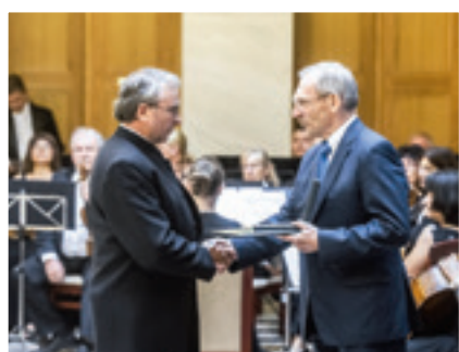
Ministar Šandor Pinter naprikdaje odličje Vinci Hergoviću

Zadnji mesec ovogodišnjega žarkoga ljeta nudio je mnoge zanimljive programe za nas. Već na početku augustuša kisečka hrvatska zajednica u velikom broju je sudjelovala u historičkoj igri u „Opsadi Kisega”. Od Bika kroz Prisiku do Židana organizirali su se Hrvatski dani, svečevali su se kiritofi. Blagoslovlili su pilj Sv. Antona Padovanskoga, naprik su dali jaslice za najmanji naraštaj u Židanu, hodočasničke grupe su srićno stigle u Celje, škole su se pripravljale na novo školsko ljeto. Koliko djela, truda, vrmena potribuju od organizatorov ovi i slični programi to samo oni znaju ki su već to probali. Ovi ljudi hvalu