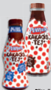
Pöttyös Kakaós Tej vagy 0% Hozzáadott Cukor 300ml, 1130 Ft/l