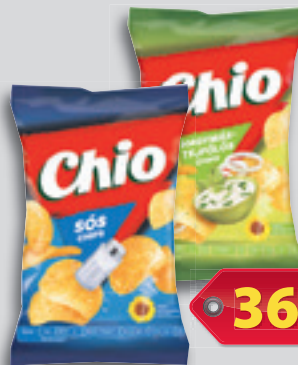
Chio Chips Sós vagy Hagymás-Tejfölös 60g, 6 150 Ft/kg