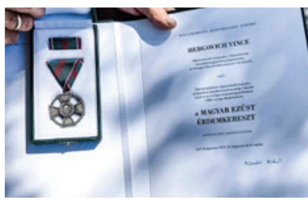
Orden srebnoga križa Ugarske