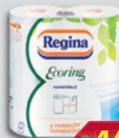
Regina Ecoring Papírtörő 2 Rétegű 2 Tekercs 225 Ft/db