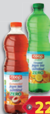
Coop Jó Nekem! Ice Tea Zero Citrom vagy Őzibarack 1.5l, 153 Ft/l