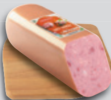
Finonimo Toast Sonkás Szelet 2290Ft/kg