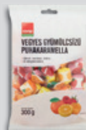
Coop Puhakaramella Vegyes ízű 300g, 1997 Ft/kg