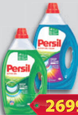
Persil Expert Gél Color vagy Normál 40Mosás 2l, 1 350 Ft/l