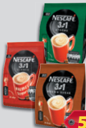
Nescafé 3in1 Tasakos Kávé Classic 10X17g, 3524 Ft/kg vagy Strong 10X17g, 3524Ft/kg vagy Barna Cukros 10x16.5g 3630Ft/kg