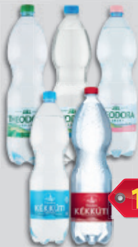
Theodora Ásványvíz Kerek Szénsavas vagy Szénsavmentes vagy Kerekí Nyhe vagy Kerekí Mentés vagy Kékkúti Dús 1.5l, 51 Ft/l (Szentkirályi Magyarország Kft.)