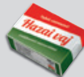
Hazai Vaj Csökkentett Zsírtartalommal 100g, 4490 Ft/kg