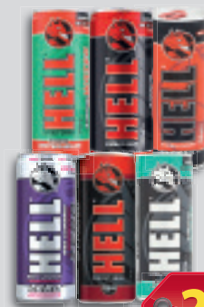
Hell Energiaital Classic vagy Strong Apple vagy Focus vagy Strong vagy Watermelon vagy Ribizli Zero 0.25l, 876 Ft/l (Hell Energy Magyarország Kft.)