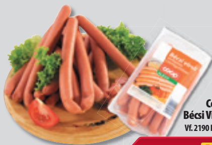
Coop Bécsi Virsli VÉ. 2190 Ft/kg