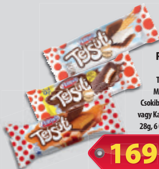
Pöttyös Tejsüti Tejes vagy Mega Csoki Csokibevonóval vagy Karamellás 28g, 6 036 Ft/kg