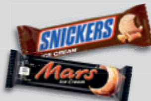
Szeletes Jégkrém Snickers Single 48g, 6 229Ft/kg vagy Mars 41.8g, 7 153 Ft/kg