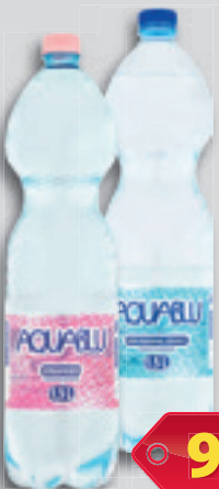
Aquablu Ásványvíz Szénsavas vagy Szénsavmentes 1.5l, 66 Ft/l