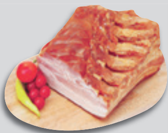
Palini Füstölt-Főtt Császárszalonna 3190Ft/kg