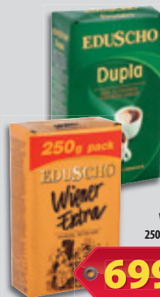
Eduscho Kávé Örölt Dupla vagy Wiener Extra 250g, 2 796 Ft/kg