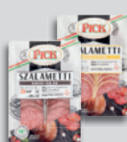
Pick Szalametti Szalámi Borsos vagy Sajtos Szvg. 70g, 7 843 Ft/kg Több ízben