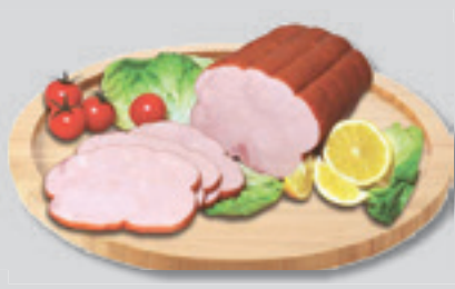
Coop Ingyenc Fűrdői Füstölt Sonka 3390 Ft/kg