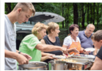
Dili se hrenovica s mjesom