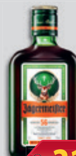
Jagermeister Keserűlikőr 35% 0.2l, 10 995 Ft/l