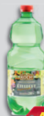
Koch Hagyományos Ételetc 20% 1l