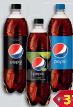
Szénsavas Üdítőital Pepsi Cola vagy Pepsi Black/Max vagy Pepsi Lime Pet 1l