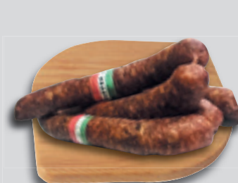
Stuffer Füstölt Házikolbász 2990 Ft/kg