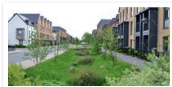
Vizes árkok, mely öltözteti az utcát is

A projektről bővebb információ: www.koszeg.hu/palyazatok