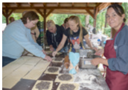
Napunjuju se lepnji s bučom i makom

Na Prisiki na „Danu sela” već tradicionalno (po šesti put) su dostala važnost hrvatska jila: hrenovica s mjesom, lepanj bučom i sirenjem ili makom, kot i vrtanj. U organizaciji Seoske samouprave, Hrvatke samouprave i Zbirke sakralne umjetnosti Hrvata u Madjarskoj šikane ženske ruke i čvrste, muške ruke pekle i kuhale su cijelo dopodne da na objed budu gotova jila i kolači. U tri kotli su Prisičani kuhali perkelt od divlje svinje, lukindroska ekipa je mišala „gaisburger marsch”, kruh s kvasom su misili Čepre-