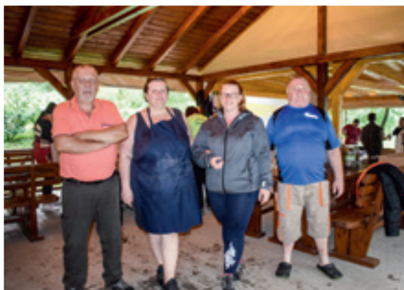
Organizatorska ekipa „Dana sela” u Prisiki