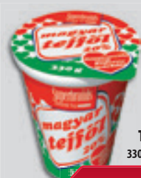
Magyar Tejföl 20% 330g, 1361 Ft/kg