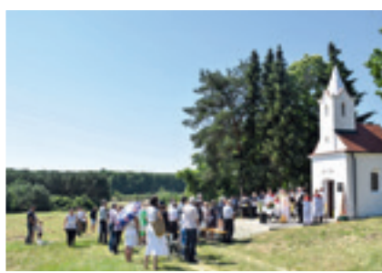
Vjerničko svečevanje pri blagoslovljenju kapele