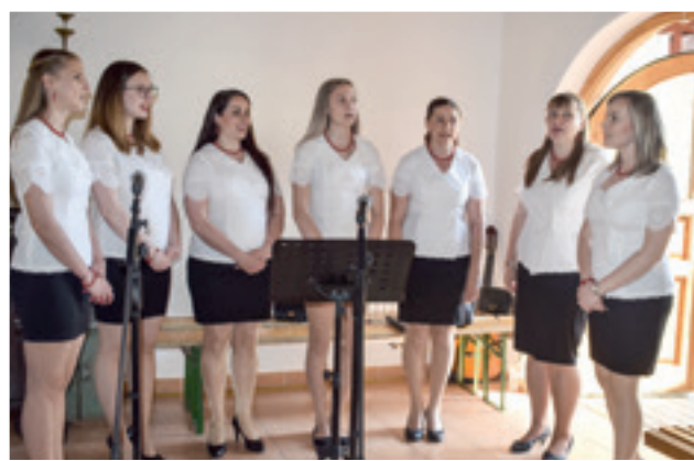
„Biseri”- ŽVS iz Unde- su muzički oblikovali program