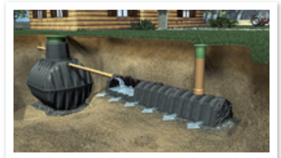
Modern esővíztároló és szikkasztó rendszer